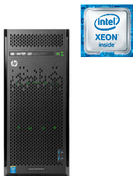
ProLiant ML110 Gen9