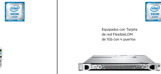
ProLiant DL360p Gen8

Equipados con Tarjeta de red FlexibleLOM de 1Gb con 4 puertos