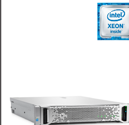
ProLiant DL380 Gen9