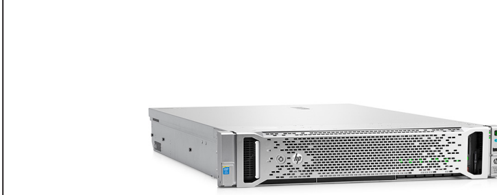
ProLiant DL180 Gen9