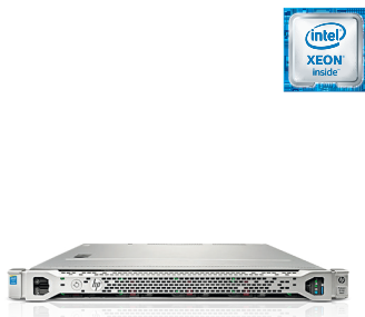
ProLiant DL160 Gen9