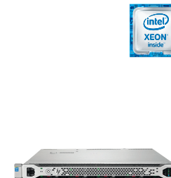
ProLiant DL360 Gen9