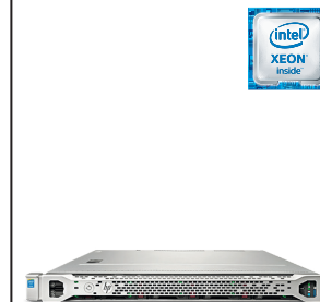
ProLiant ML110 Gen9