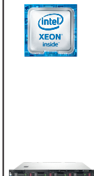
ProLiant DL60 Gen9