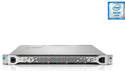
ProLiant DL360 Gen9