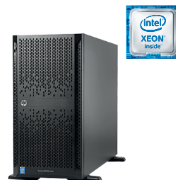
ProLiant ML350 Gen9