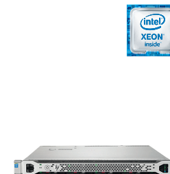
ProLiant DL360 Gen9