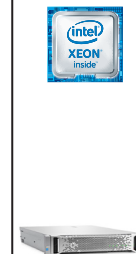
ProLiant DL180 Gen9