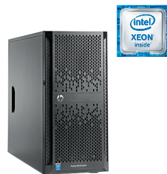
ProLiant ML150 Gen9