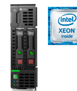
BL460C Gen9 Ref.: N2G74A