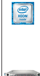
ProLiant DL160 Gen9