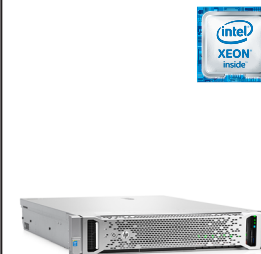
ProLiant DL380 Gen9