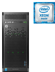
ProLiant ML110 Gen9