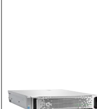
ProLiant DL180 Gen9