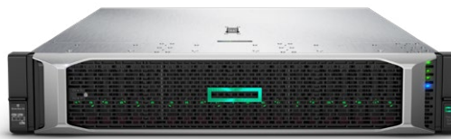
ProLiant DL380 Gen10