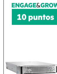
ProLiant DL380 Gen9