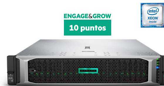
ProLiant DL380 Gen10