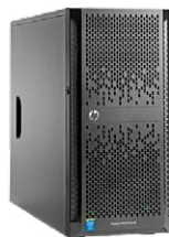
ProLiant ML150 Gen9