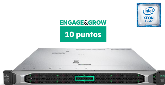
ProLiant DL360 Gen10