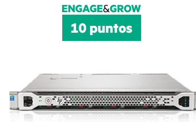
ProLiant DL360 Gen9