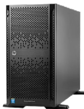
ProLiant ML350 Gen9