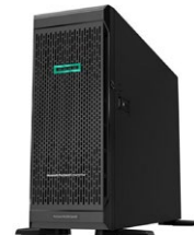
ProLiant ML350 Gen10