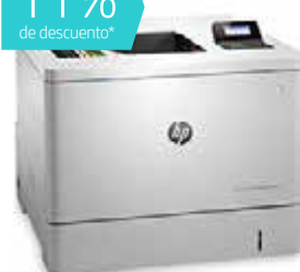
HP Color LaserJet Enterprise M553x (Ref.: B5L26A) PDF