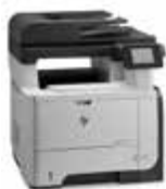
HP LaserJet Pro 500 MFP M521