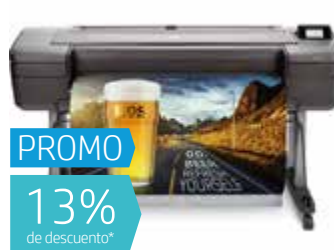
HP DesignJet Z9+ PS 24" (Ref.: W3Z71A)