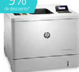
HP Color LaserJet Enterprise M553dn (Ref.: B5L25A) PDF