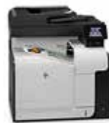
HP LaserJet Pro 500 color MFP M570